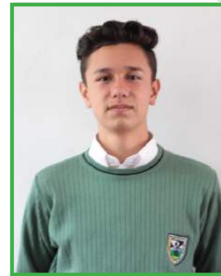
Montaña Rodríguez 11A